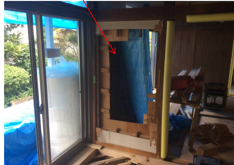
飾り棚になる場所

2014/7/25(金) 食堂と応接の間の間仕切り壁の間に穴が空けられています。この部分はさらにきれいな仕上げ材を取り除いていき、飾り棚を兼ねた視線の通る壁に造り替える場所になります。少し完成後のイメージがわいてきました。